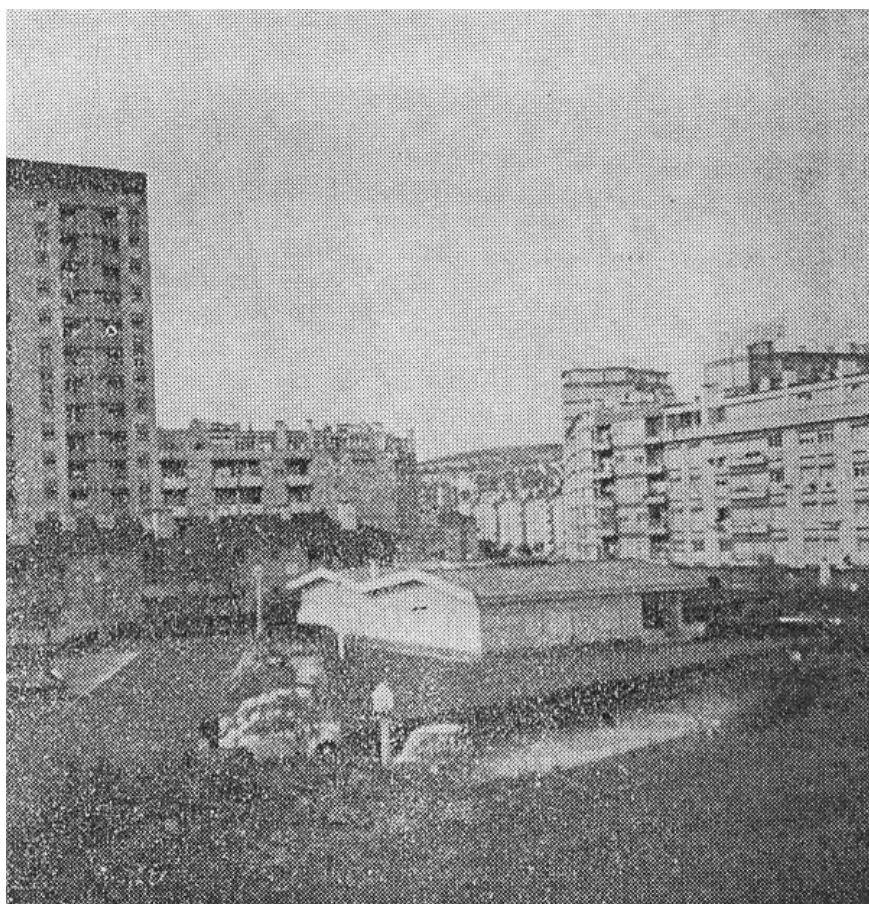
Ilustração 3.- Vista da zona norte da Reboleira, tal como veio a ser edificada.

condições de mobilidade quotidiana. O apeadeiro de caminho de ferro não foi tornado operacional, condicionando a população residente a deslocar-se em autocarro ou a pé para as estações vizinhas. 11