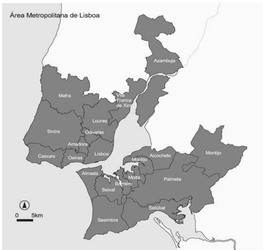
Ilustração 1.- Carta da Grande Área Metropolitana de Lisboa, entidade político-administrativa criada no quadro da Lei 10/2003 de 13 de Maio [Segundo o critério oficial, a Grande Área Metropolitana de Lisboa é formada pelos concelhos de Alcochete, Almada, Amadora, Barreiro, Cascais, Lisboa, Loures, Mafra, Moita, Montijo, Odivelas, Oeiras, Palmela, Seixal, Sesimbra, Setúbal, Sintra, Vila Franca de Xira. Territorialmente, este conjunto perfaz 2 962 km 2 e nele residem cerca de 2 milhões e seiscentos mil habitantes. Todavia, neste artigo utilizámos um critério menos abrangente, e referimo-nos a um conjunto de concelhos mais restrito: composto por Cascais, Oeiras, Sintra, Amadora, Odivelas, Loures Vila Franca de Xira e Lisboa, na margem norte; Almada, Seixal, Barreiro, Moita, Montijo, na margem sul; totalizando cerca de 1 648 km 2 , a população residente neste conjunto de concelhos ascende a 2 milhões e trezentas mil pessoas].

Historicamente, os concelhos da margem norte do Tejo aumentam muito a sua importância populacional no conjunto da área metropolitana de Lisboa (Ilustração 1). Se em 1864 a conjugação destes concelhos não ultrapassava os 22,3% de população de Lisboa e arredores, em 1930 desce mesmo para os 17,6%, já em 1960 cresce para os 27,6%, para em 2001 se instalar nos 55,6% .