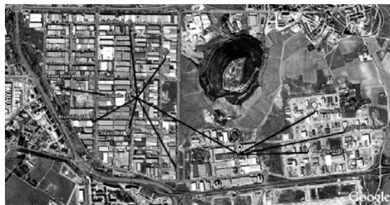
Fig.5. Ejemplo de planificación de un proyecto WIFI en un polígono industrial.

La problemática específica de los pequeños núcleos de población hace, también para los cableados en la vía, que no sea tan rígida su aplicación y que la mayoría de las veces la ordenanza, si la hay, sea la misma para todos los cableados, dando más importancia a las redes eléctricas y a los cables de la antigua Compañía Telefónica Nacional de España. Las nuevas instalaciones de redes de telecomunicaciones tienen menos repercusión; sin embargo, hasta hace pocos años lo habitual para las compañías instaladoras era apoyar los cables en las fachadas de los edificios o bien en postes, como ha ocurrido con instalaciones eléctricas, de telefonía o telegrafía durante los últimos años.