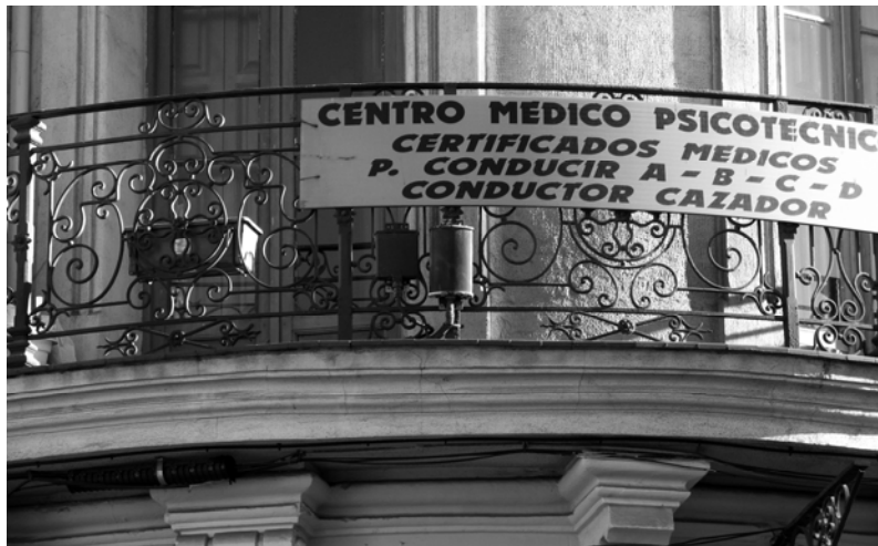
Fig.3. Ejemplo de microceldas.

Estará sujeta a los mismos requisitos que la primera instalación la renovación o sustitución completa de una instalación y la reforma de las características de las mismas que hayan sido determinantes para su autorización o sustitución de alguno de sus elementos relevantes por otros de características diferentes a las autorizadas 18 .