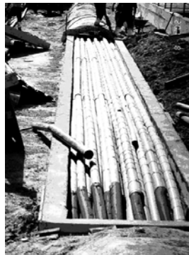
Fig.4. Ejemplo de exceso de tuberías para cableados en una canalización.

La canalización para telecomunicaciones discurrirá por debajo del resto de servicios, excepto el saneamiento, aumentando el espesor de la zona de relleno bajo el firme cuanto sea necesario para ello. Si la canalización de telecomunicaciones debe discurrir en paralelo con otros servicios, deberá hacerlo al lado de éstos, nunca por encima o por debajo. Cuando sea precisa la adopción de otras soluciones para el trazado de las canalizaciones, como es el caso de las galerías, o el trazado subterráneo no sea viable por cruzar corrientes de agua, o tener que discurrir por puentes o túneles en voladizo, se deberán tener en cuenta los criterios de seguridad, mantenimiento y mínimo impacto 25 .