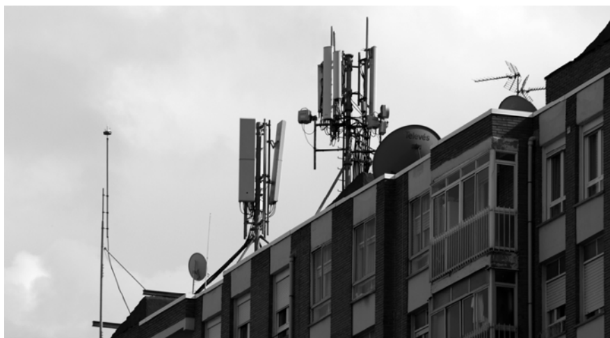
Fig.2. Ejemplo de amasijo de instalaciones sobre la cubierta de un edificio residencial: pararrayos, antenas convencionales de televisión, antenas parabólicas y, sobre todo, instalaciones diversas de transmisión de telefonía celular.

En polígonos industriales de nueva creación en algunas ordenanzas solamente se permitirán estas instalaciones en parcelas previstas en el planeamiento para equipamientos. En polígonos industriales ya existentes donde lo previsto en el párrafo anterior no sea factible, al ubicar las instalaciones deberán respetarse, en la medida de lo posible, las distancias mínimas a linderos y demás normativa aplicable, colocándose el Recinto Contenedor acorde con la construcción 11 .