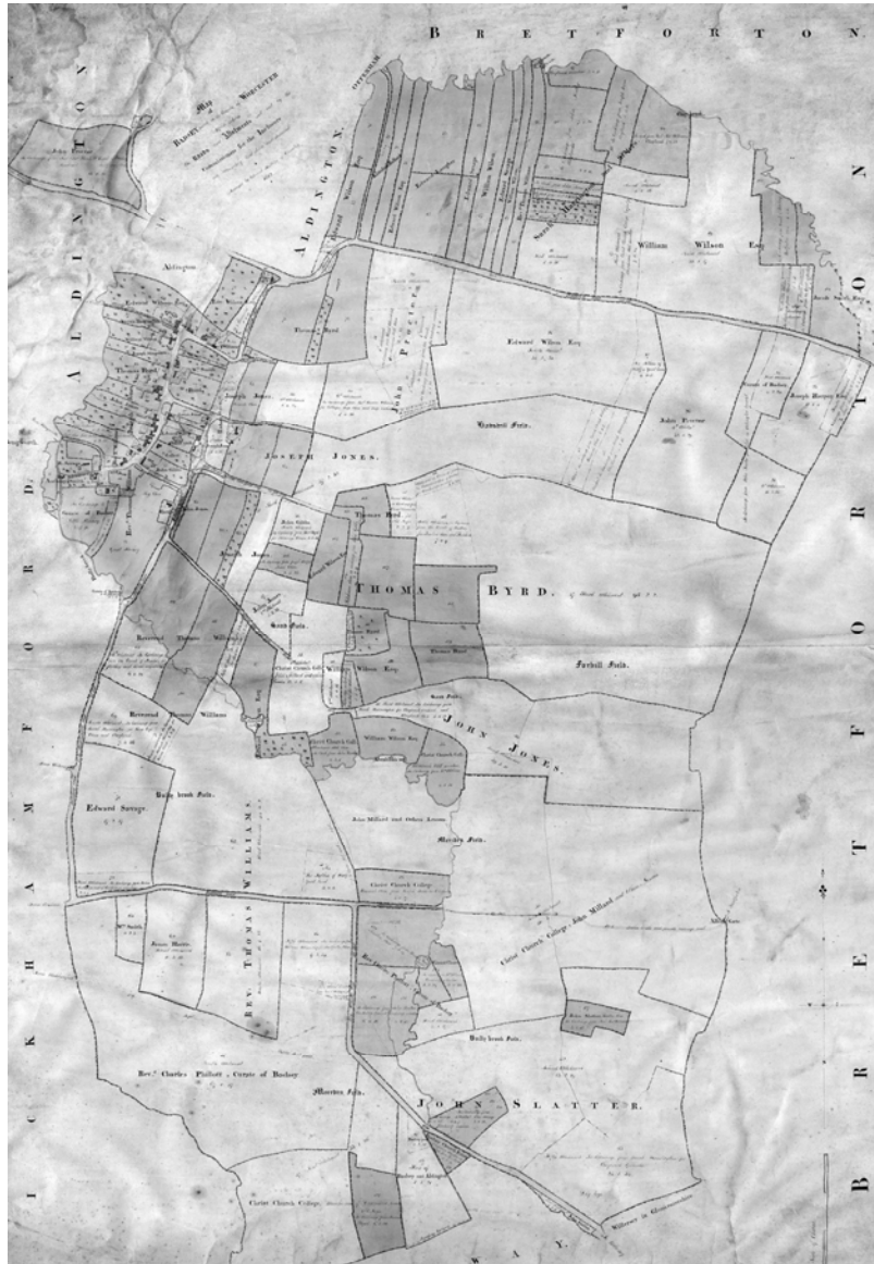
Fig. 3. Badsey, Worcestershire (1812). Enclosure Map que acompañaba al Award de 1815, reflejando la distribución parcelaria postoperacional. Las fincas no sombreadas habían pertenecido al régimen de open field antes del cercamiento.

plazos de ejecución de las obras y obligaciones de los propietarios. En 1801 la aprobación de la Inclosure Consolidation Act –revisada en 1836 y 1845 como General Inclosure Act – simplificó el proceso al fijar condiciones generales para todos los cercamientos, haciendo innecesaria la preparación de leyes individuales.