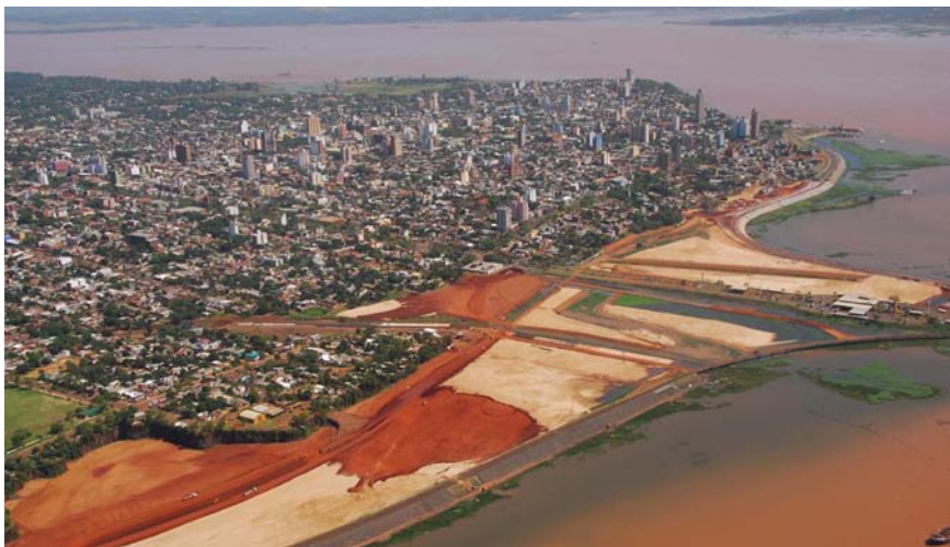
Fig. 3. Zona costera. Aumento del nivel de cota del río Paraná a la altura de la cabecera del puente internacional Posadas-Encarnación.

El proyecto Costanera como parte de las obras complementarias de Yacyretá, y las consecuentes relocalizaciones han tenido un efecto re-estructurador de la ciudad de Posadas. Los “bolsones de pobreza” ya no se localizan dispersos sobre el espacio urbano. El amplio margen al río Paraná, tradicionalmente ocupado por asentamientos precarios, se fue convirtiendo literalmente en “zonas liberada de la