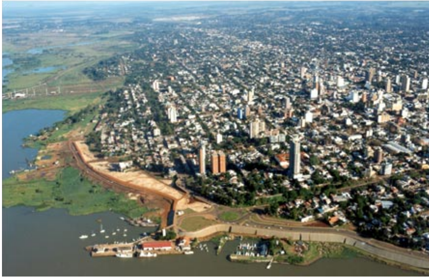
Fig. 2. Zona costera. Un tramo de la avenida Costanera.