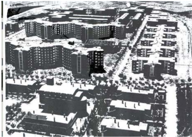
Fig. 4. Vista de conjunto.

trama de bloques y no forman un conjunto específico. Se deduce de su distribución espacial que el grupo de mandos intermedios pretendía ser el aglutinador de toda la comunidad, mezclándose con el conjunto de los obreros mientras que los ingenieros y directivos podían mantener una posición más distante.