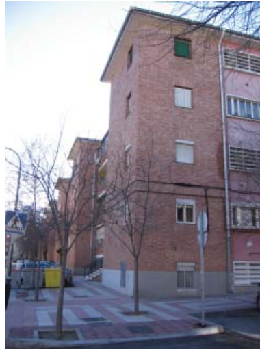
Fig. 7. Viviendas para obreros.

de la adjudicación; para ser usuario de las viviendas también había establecidas ciertas obligaciones: ser productor de ENASA, gozar de la consideración en la empresa y no tener notas desfavorables en el expediente, no tener otra vivienda en propiedad (si la que se tenía era en régimen de alquiler, la empresa se reservaba la opción de entregarle una dentro del poblado) y estar casado o con familiares a cargo, siendo preferente el primer caso.