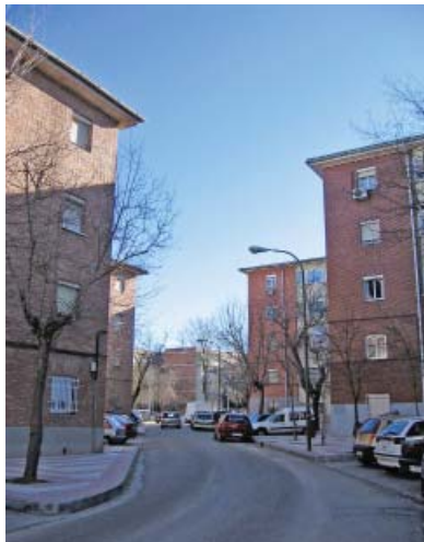
Fig. 11. Espacios interbloque.

Ciudad Pegaso fue creada por una empresa nacional (ENASA) para alojar a sus empleados que en muchos casos no eran obreros especializados, sino inmigrantes rurales sin medios que llegaban a Madrid en busca de un modo de vida mejor. Las consideraciones teóricas que se manejaban en la época determinan claramente la concepción de su diseño. Las ideas falangistas que al inicio de la guerra apelaban a la conciencia proletaria para despertar sentimientos de solidaridad nacional, van a mutar en total desprecio del oponente derrotado una vez acabada la contienda. La “jerarquía suprema” de la Nación aplasta a los vencidos que no sólo han perdido todos sus derechos como ciudadanos sino que incluso deberán esforzarse a base de sacrificio y trabajo para recuperar su estatus de “españoles”. Este ideario impregna la vida social y también el urbanismo. Tanto los usos del espacio, como su relación con la ciudad y la forma de entender el binomio de medios de producción y organización social responden a la ideología dominante. Todo el conjunto debe su configuración a estos esquemas mentales en los que predomina el aislamiento respecto al exterior y la segregación tipológica y espacial en función de la escala social de sus habitantes al interior. La realidad es la trasposición del esquema jerárquico de la empresa sobre el plano: viviendas unifamiliares para directivos, viviendas pareadas para mandos intermedios y bloques para el resto de categorías.