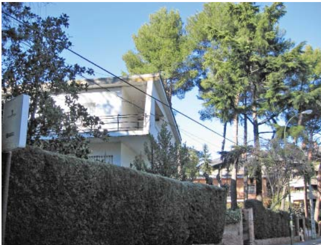
Fig. 9. Viviendas para directivos.

El control de la vida de los residentes a través de este Reglamento era intenso. Cada trabajador tenía muy presente la necesidad de conservar el orden en los ámbitos laboral y familiar. Se mantenía la disciplina en la empresa por medio de la amenaza de despido. Una vez fuera del horario laboral la coerción venía dada por el miedo al desahucio. En ambos casos, la posibilidad de cometer una falta provocaba la pérdida de ambos bienes, la vivienda y el puesto de trabajo. Por otro lado se promovía el compromiso del trabajador con la empresa implicando a sus familiares, ya fuese en el uso de instalaciones y servicios (consultorio médico, asistencia al colegio de los hijos en edad escolar, etc.), así como en las facilidades de incorporación de los mismos a un futuro empleo en la fábrica.