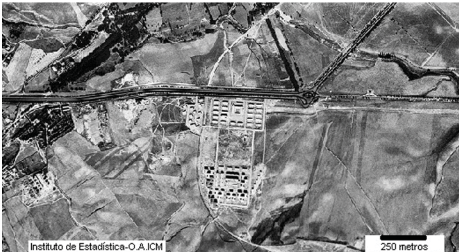
Fig. 1. Foto aérea de Ciudad Pegaso (Primera fase)

El poblado de Ciudad Pegaso fue diseñado por Francisco Bellosillo y Juan Bautista Esquer. La Empresa Nacional de Autocamiones (ENASA), vinculada al Instituto Nacional de Industria (INI), fue quien encargó el proyecto. Es un ejemplo de vivienda social de la década de los 50 como forma de expansión de la ciudad de Madrid a lo largo del eje de la carretera de Barcelona en base a la especialización de colonias residenciales.