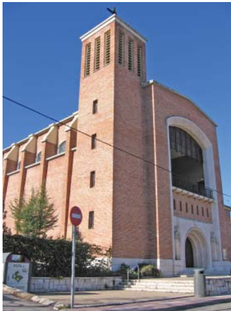
Fig. 10. Iglesia de san Cristóbal.

Ya tradicionalmente, debido a la especial relación de los inquilinos con el propietario ENASA las obras en los inmuebles estaban muy restringidas. ENASA se encargaba del mantenimiento general del poblado y sus edificaciones, mientras que al ocupante de cada vivienda sólo le estaban permitidas las reparaciones de carácter menor. Esta condición de barrio inalterado se va a mantener en el tiempo a pesar de la privatización de las viviendas, por la decisión del PGOUM de 1985, de incluirlo en la ordenanza 3ª, nivel a): mantenimiento de la edificación. Objetivo cumplido en gran parte a excepción de las pequeñas modificaciones ya comentadas: cierre de parcelas con tapias y vallados, donde anteriormente sólo había un seto y construcción de edificaciones complementarias (garajes) en las traseras de las viviendas.