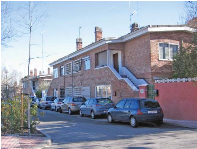
Fig. 8. Viviendas para mandos intermedios.

El desahucio se contemplaba en las siguientes situaciones: por cese en la empresa, por falta de pago del alquiler, por ocupar la vivienda indebidamente o por no ser el domicilio permanente, por cambio de uso de la misma, por cesión o subarriendo aunque no existiese afán de lucro, por daños a la edificación o ejecución de obras sin permiso, por realizar actividades no permitidas (“inmorales, peligrosas, incómodas o insalubres”), por falta de higiene o moralidad, por escándalo o maltrato de palabra u obra a otros inquilinos o sus familiares, o por lo que se considerase como infracción grave dictada por la Empresa y los Reglamentos vigentes en cada caso.