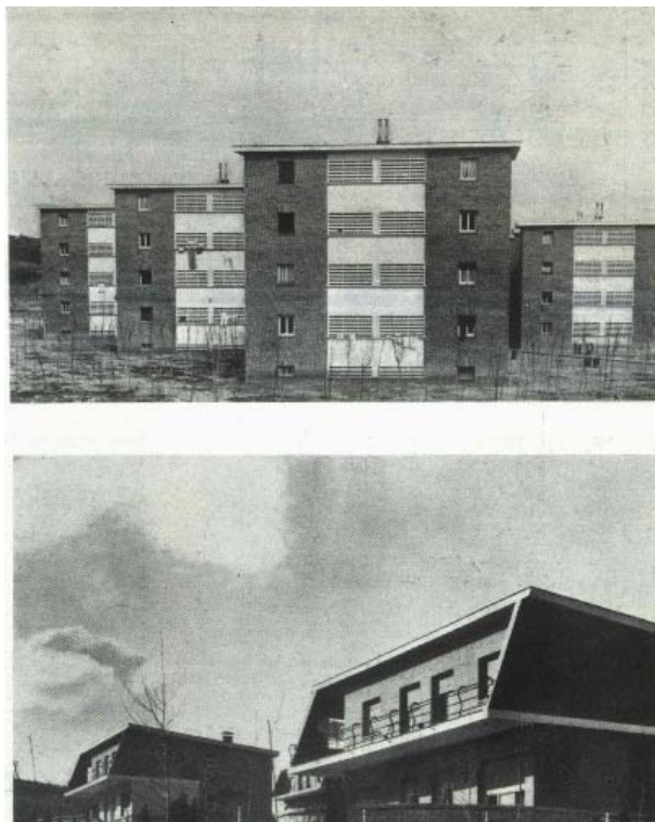
Fig. 3. Viviendas construidas.

Las viviendas para directivos y la residencia de ingenieros se localizaban a lo largo de la Séptima Avenida, de trazado más sinuoso que las demás y con acceso propio desde la vía de servicio de la Nacional II. Seguía un esquema típico de ciudad-jardín frente a la regularidad de trazados del resto del poblado y va a complementarse a partir de la ejecución de la segunda fase con los equipamientos escolar y deportivo. Todos ellos estaban separados físicamente del resto del poblado por la línea de ferrocarril.