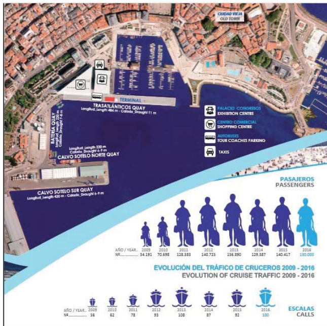
Fig. 3. Material promocional del Puerto de A Coruña como destino crucerista.