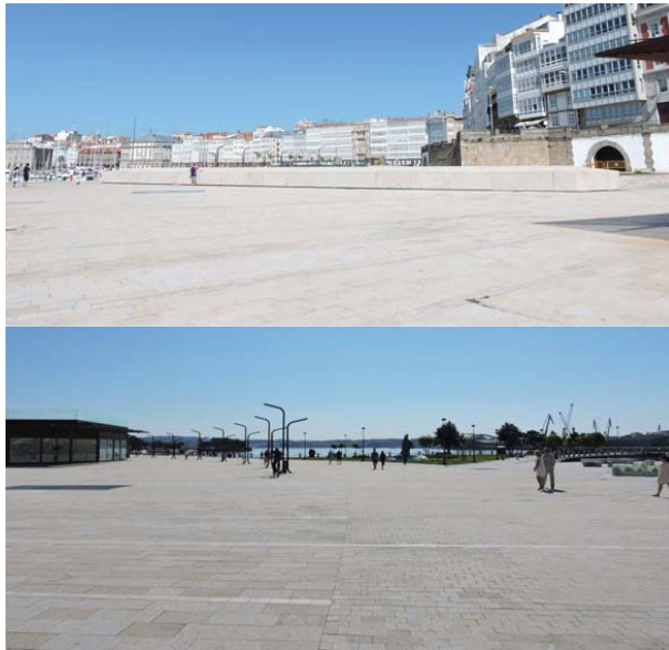
Fig. 2. Vista frontal y posterior de la explanada de la Mariña.